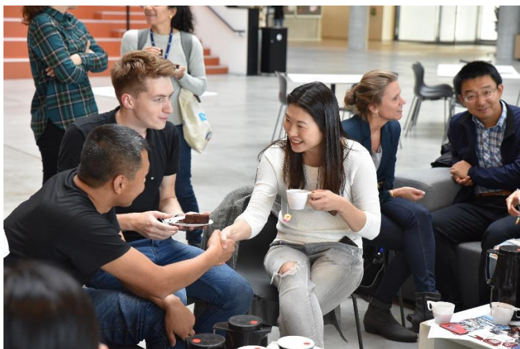
Stemmingsbillede fra et af AAU's "Fyraften – AAU Staff Meet Up" arrangementer.