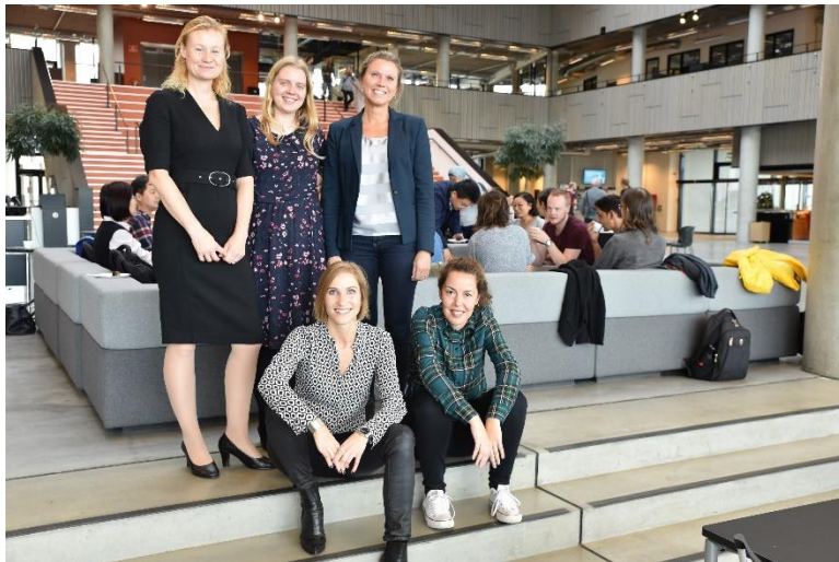
Teamet hos Aalborg Universitets International Staff Unit